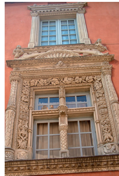
Fenêtre Renaissance dans le village

Découvrez l'histoire, le patrimoine et les curiosités de Rougiers en suivant le circuit proposé, composé de panneaux numérotés, ou en lisant ceux que vous croiserez au hasard des rues. Lors de votre balade, prenez le temps d'observer autour de vous les détails qui font la richesse du patrimoine et n'hésitez pas à sortir de l'itinéraire balisé.