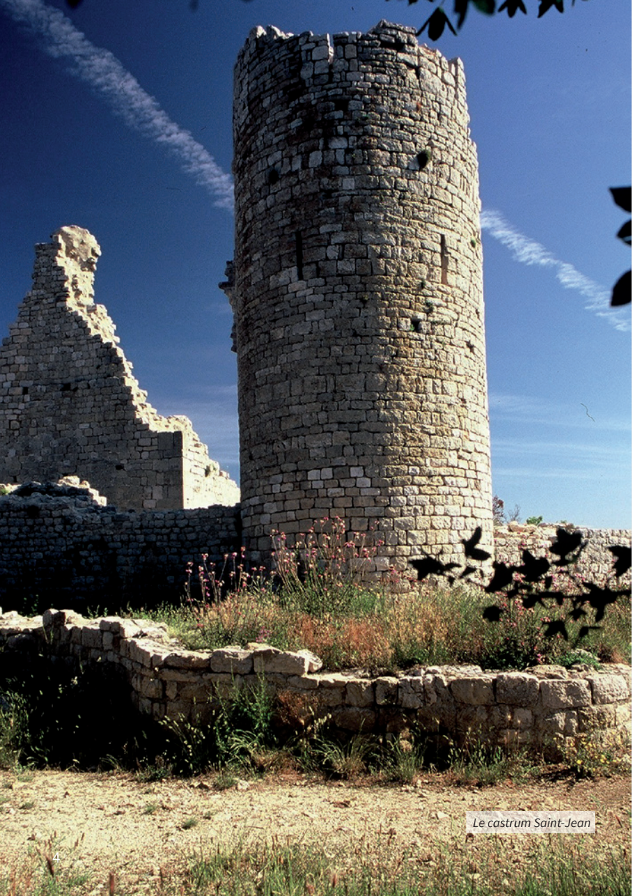
Le castrum Saint-Jean