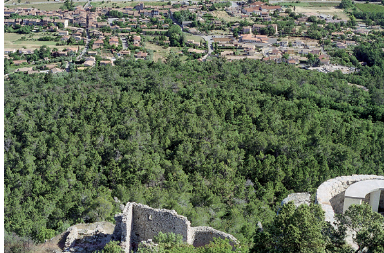
Vue du castrum